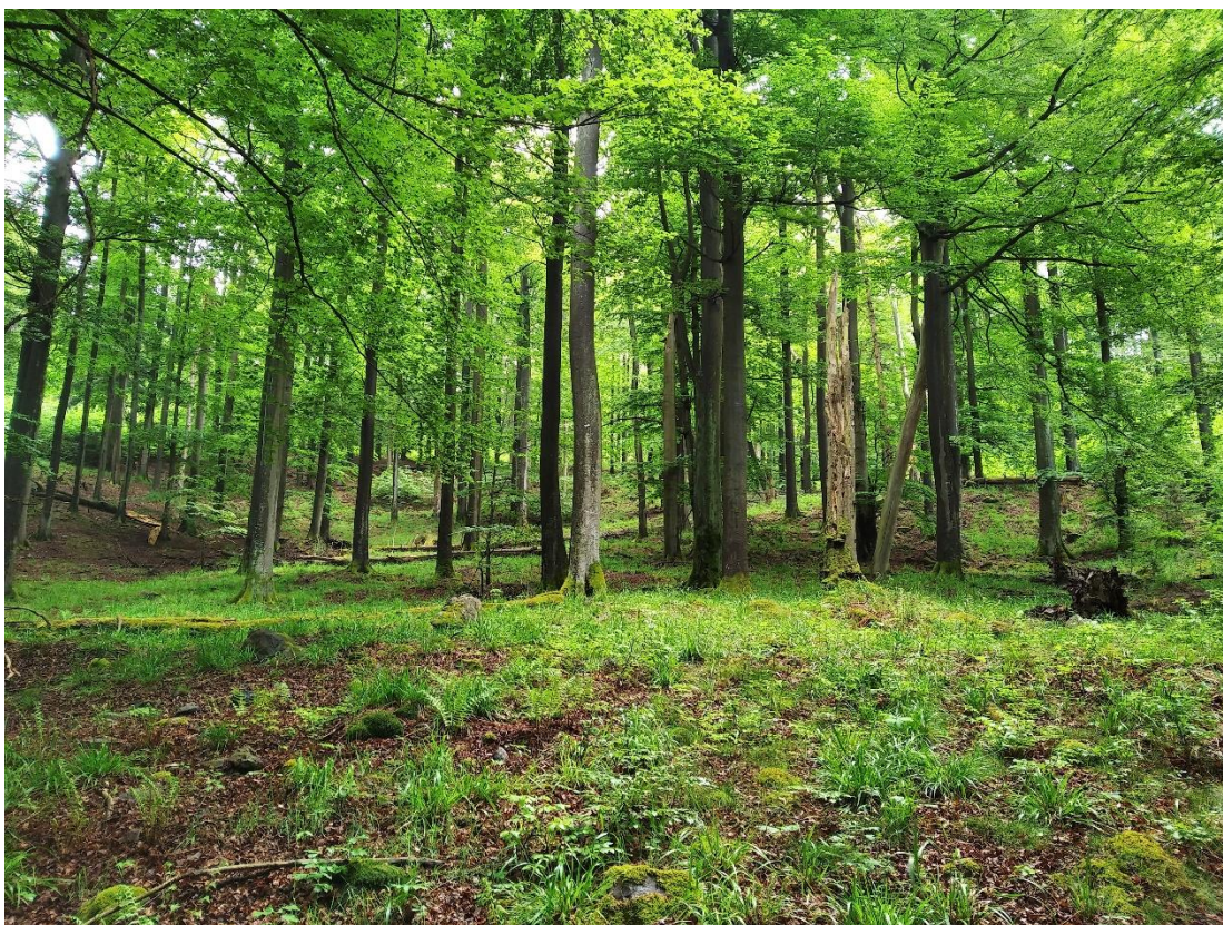
Foto 6: Bučina v S části DP 17/5a/1a je jedním z mála míst v PR, které postrádá bujné zmlazení i větší množství mrtvého dřeva (14. 5. 2020).