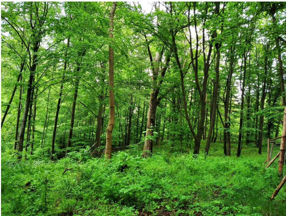
Foto 3: Pohled do jedné z 6 oplocenek s výsadbou jedle a bujným zmlazením zejména klenů a buku v J části DP 17/5a/1a (14. 5. 2020).