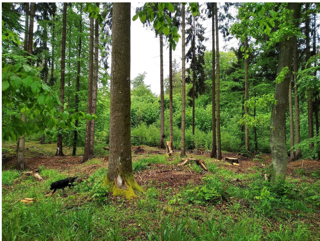
Foto 2: Rozpadající se částečně odtěžená smrčina v DP 156A12, v pozadí zmlazení buku a mlazina v DP 156A2 (14. 5. 2020).