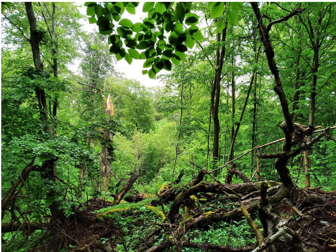
Foto 5: Vrcholová část DP 17/5a/1a je místy těžko prostupná pro velké množství mrtvého dřeva, zmlazení i bujné bylinné patro. Pohled mimo oplocenku, oplocenka je vidět vpravo (14. 5. 2020).