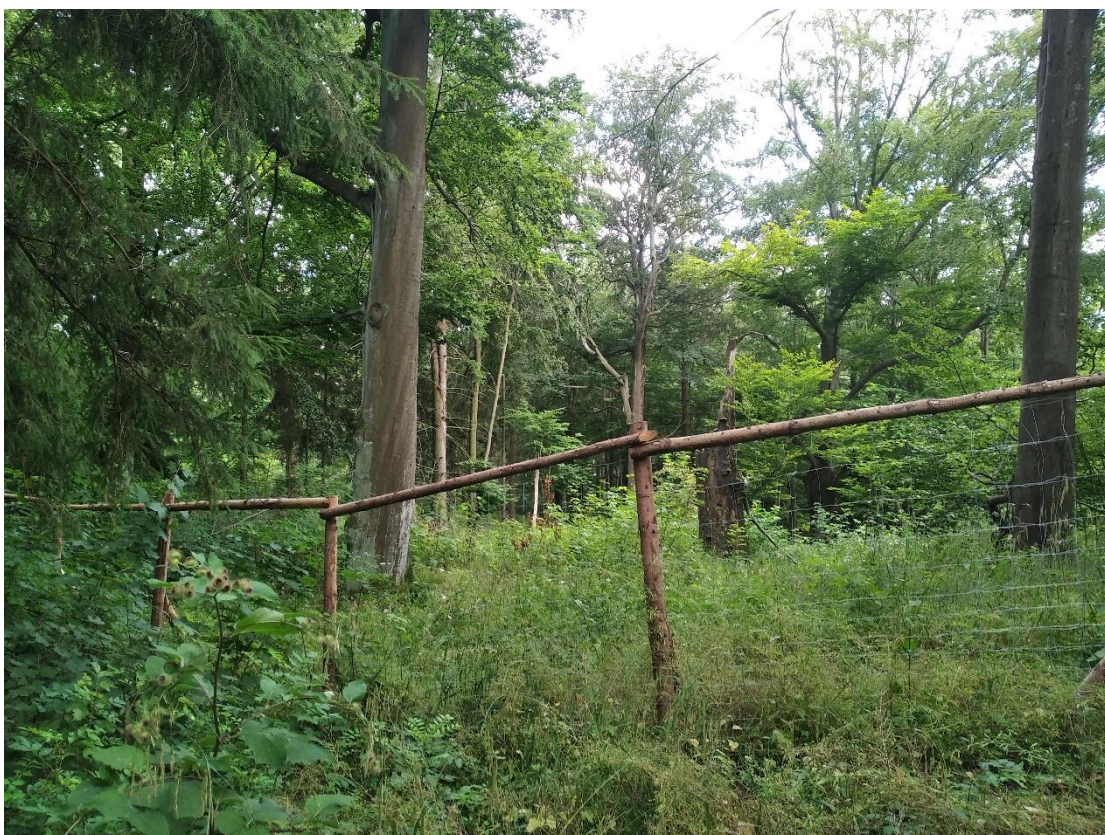
Foto 4: Pohled do jedné z oplocených světlin ve vrcholové části DP 17/5a/1a s výsadbou jedle (23. 7. 2020).