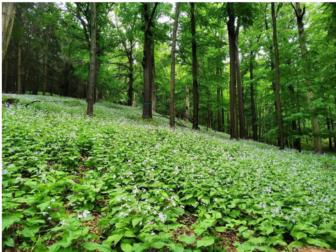
Foto1: Suťový les s dominantní měsíčnicí vytrvalou v SV části DP 156A7. V levém rohu je vidět smrčina v DP 156A5b(07), 14. 5. 2020.