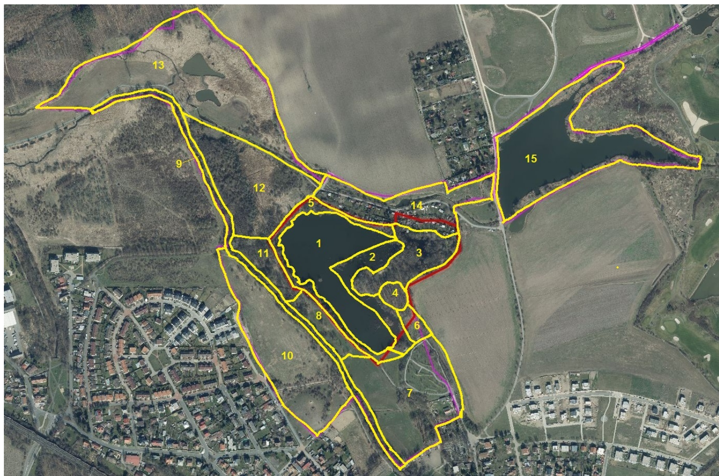
Příloha 4. – Zákres dílčích ploch přírodní rezervace a ochranného pásma