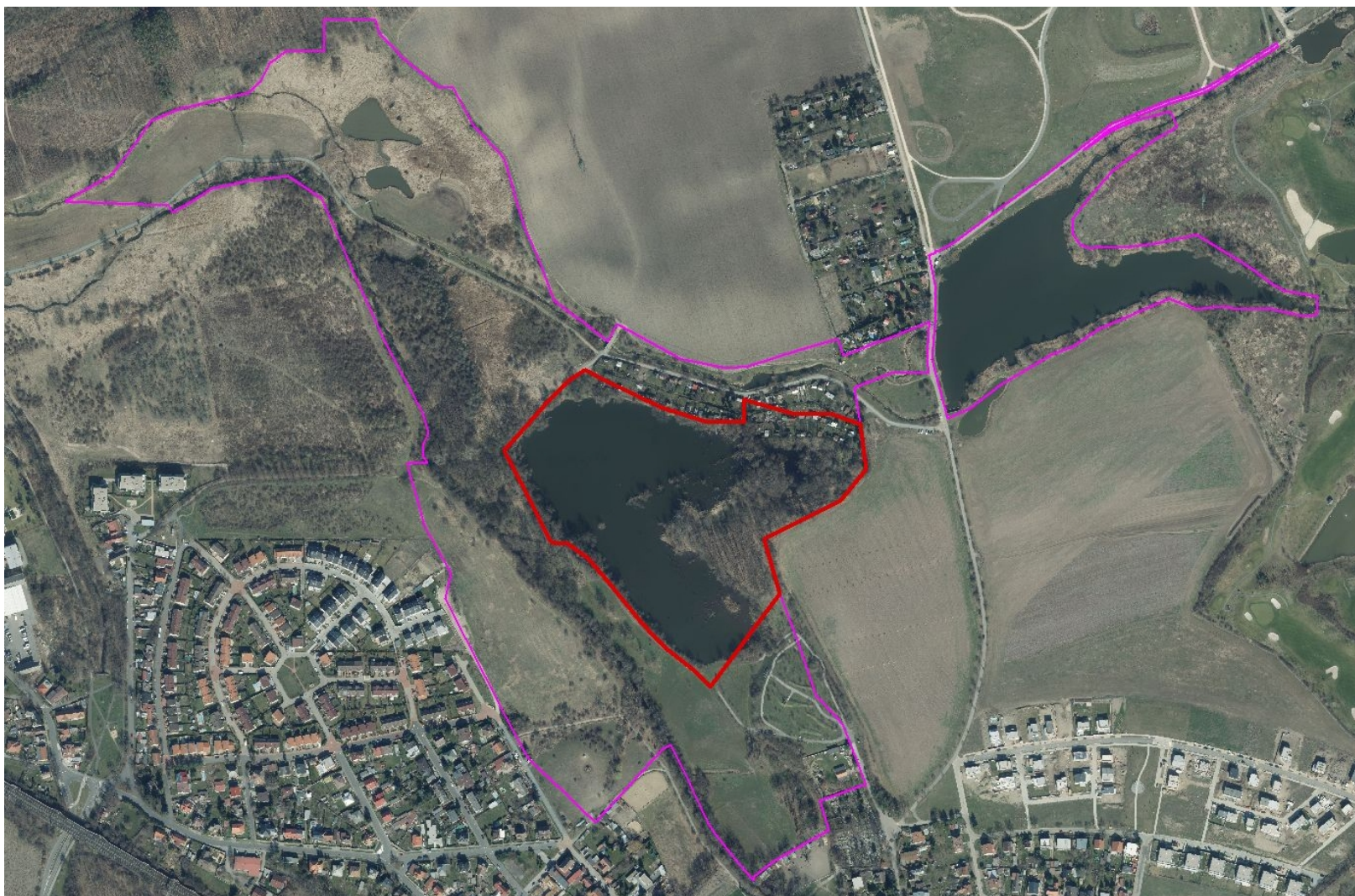
Příloha 3. – Zákres hranic území do ortofotomapy ČR. červeně – přírodní rezervace, fialově – ochranné pásmo