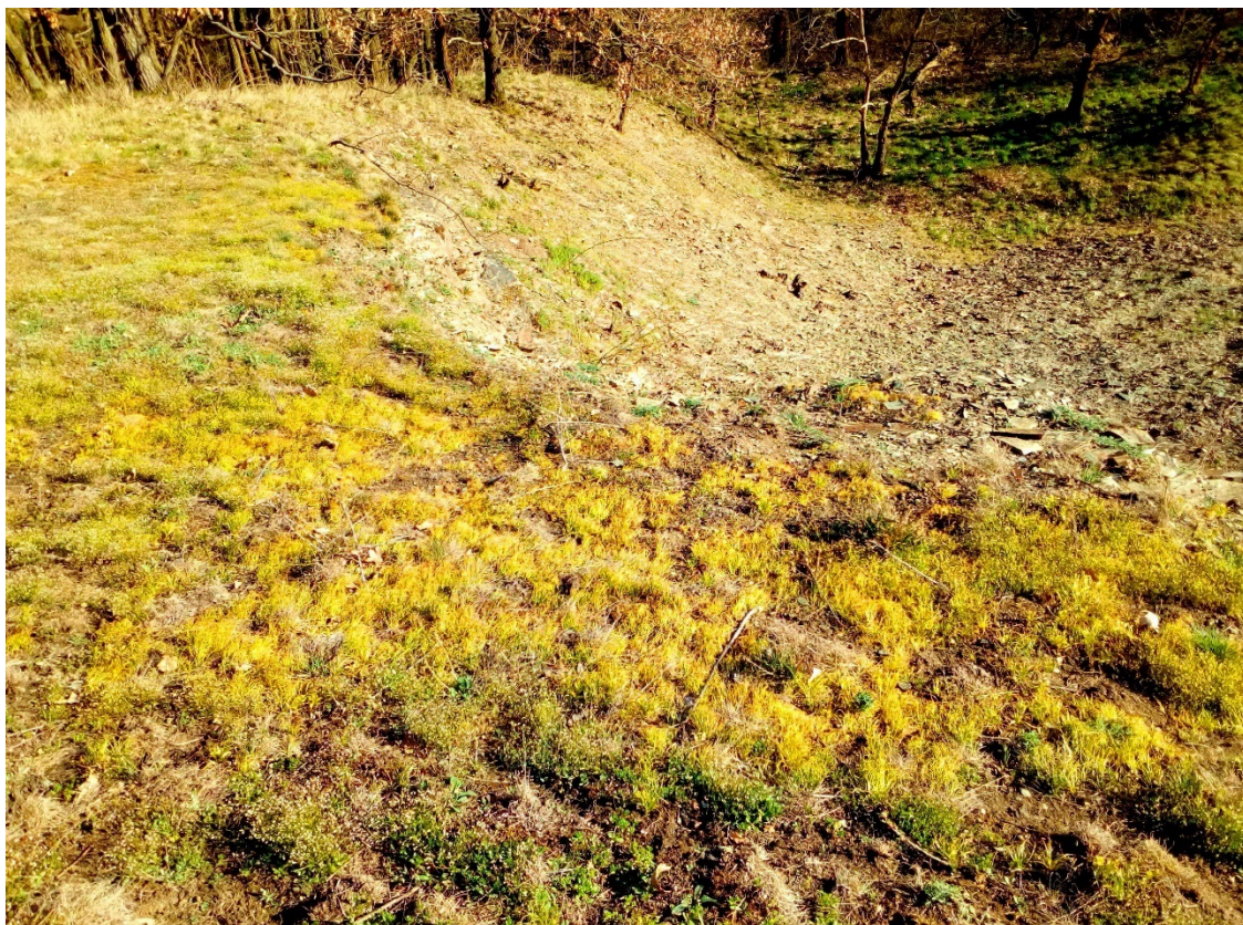
plocha 1 – sterilní koberce křivatce českého při horním lemu lomu (1. dubna)