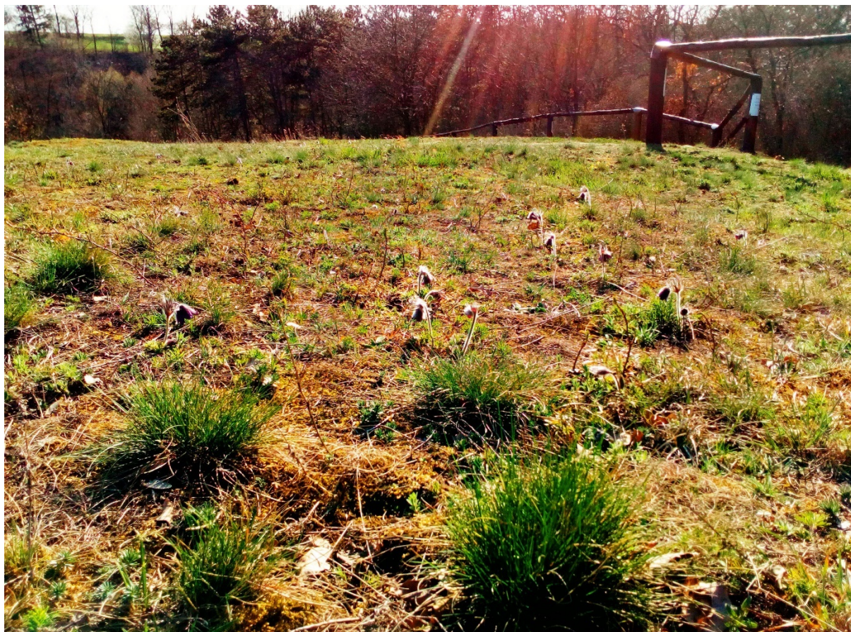
plocha 1 – koniklec luční český ( Pulsatilla pratensis subsp. bohémica ) v horní části (1. dubna)