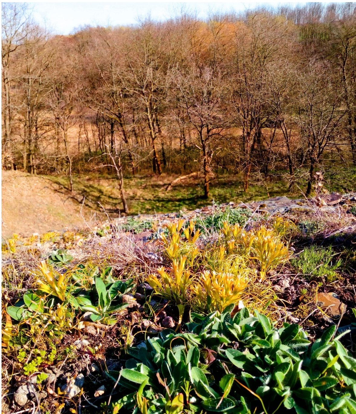
plocha 1 – křivatec český při horním lemu lomu (1. dubna)