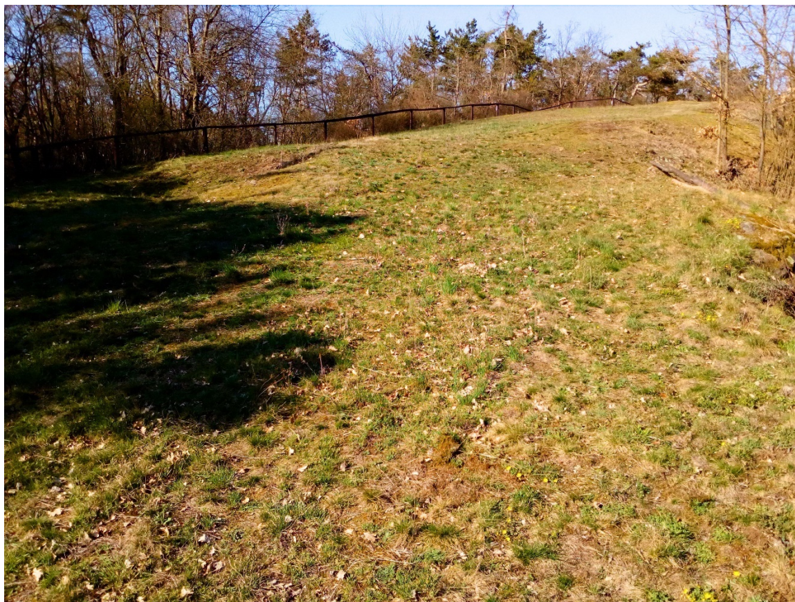
plocha 1 – step v dolní části (přelom květen/červen)