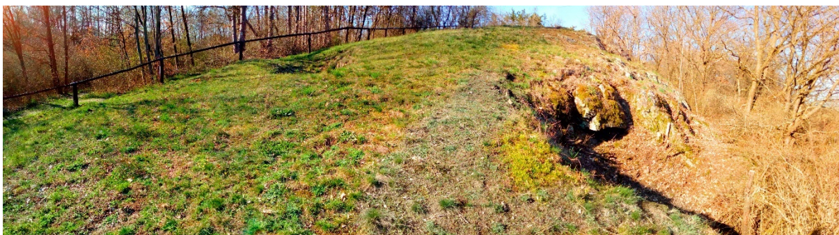
plocha 1 – sterilní koberce křivatce českého v dolní části u hrany lomu (1. dubna)