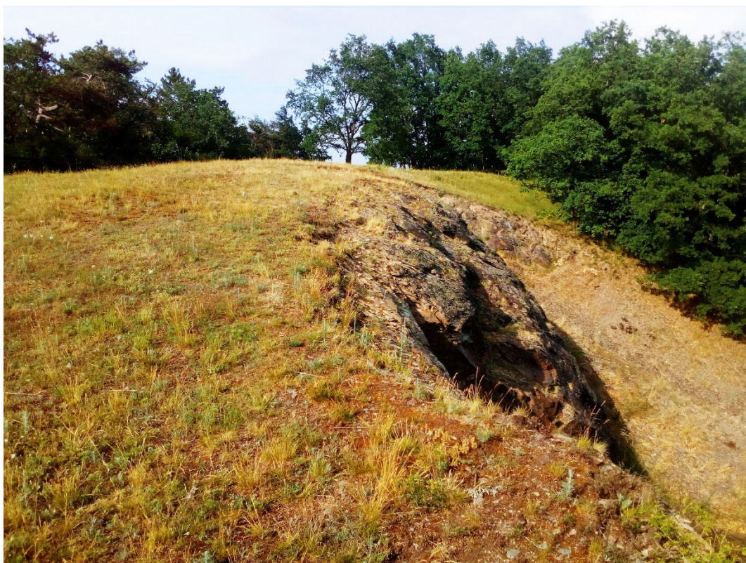
plocha 1 – step u lomu (přelom květen/červen)