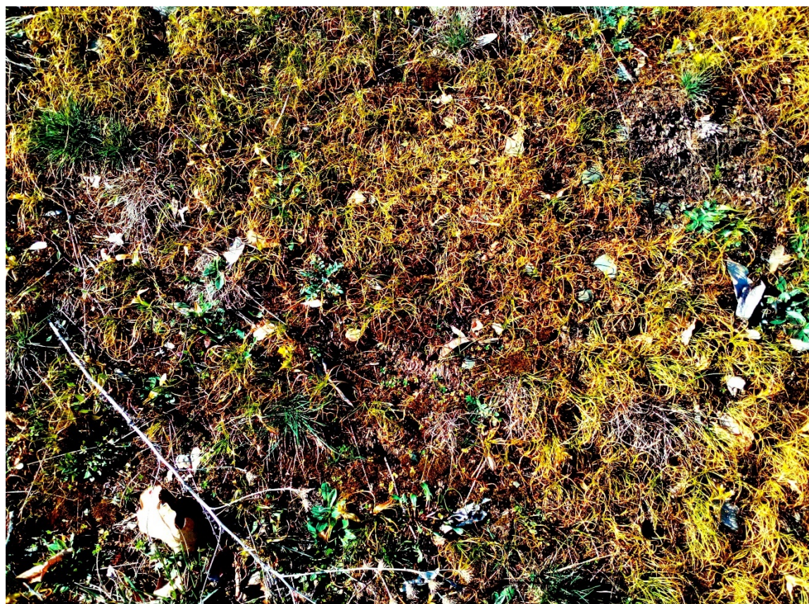
plocha 1 – sterilní koberce křivatce českého při horním lemu lomu (1. dubna)