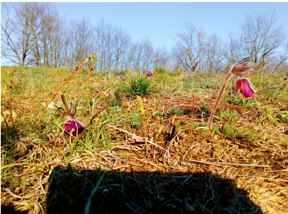
plocha 1 – koniklec luční český ( Pulsatilla pratensis subsp. bohemica ) v horní části (1. dubna)