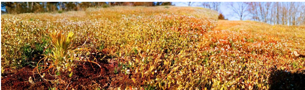
plocha 1 – křivatec český při horním lemu lomu (1. dubna)