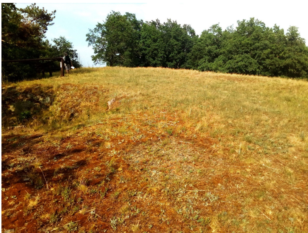
plocha 1 – step v horní části (přelom květen/červen)